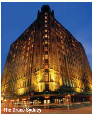
The Grace Sydney

不管您是到来旅游,洽谈生意或是寻找欢乐,您都可期望FHI为您提供热情的礼待,卓越的酒店设备与服务,以及最佳的地点.这也是FHI许下的承诺.