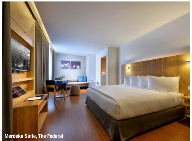
Merdeka Suite, The Federal

吉隆坡首都酒店率先推行的10ROOMS概念,以到来经商或休闲的房客为导向.这些具有远见的房客,都期望所预定的酒店能给他们带来更加独特的住宿体验.每间10ROOMS的面积,构造与装潢都不相同;唯一共同点则是这些客房豪华舒适,设备现代化,并且让房客能够观赏到壮观的市容.