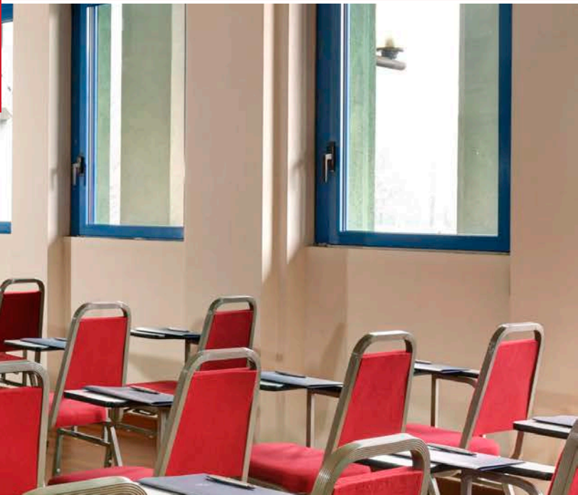
SAMPLE STANDARD SET UPS