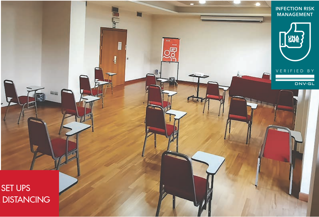
SAMPLE SET UPS WITH SOCIAL DISTANCING