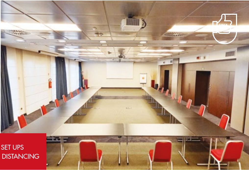
SAMPLE SET UPS WITH SOCIAL DISTANCING