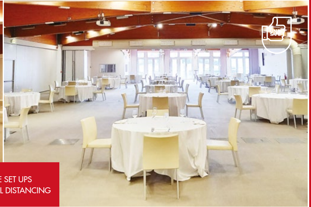
SAMPLE SET UPS WITH SOCIAL DISTANCING