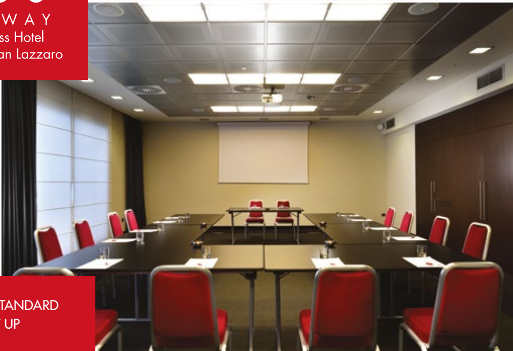
SAMPLE STANDARD SET UP