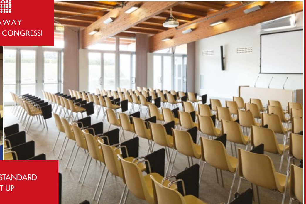
SAMPLE STANDARD SET UP