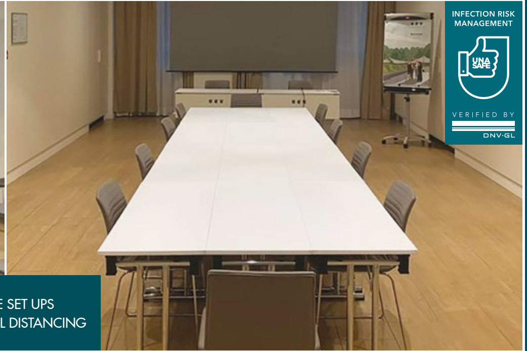
SAMPLE SET UPS WITH SOCIAL DISTANCING