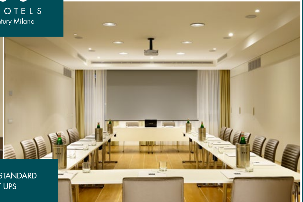
SAMPLE STANDARD SET UPS