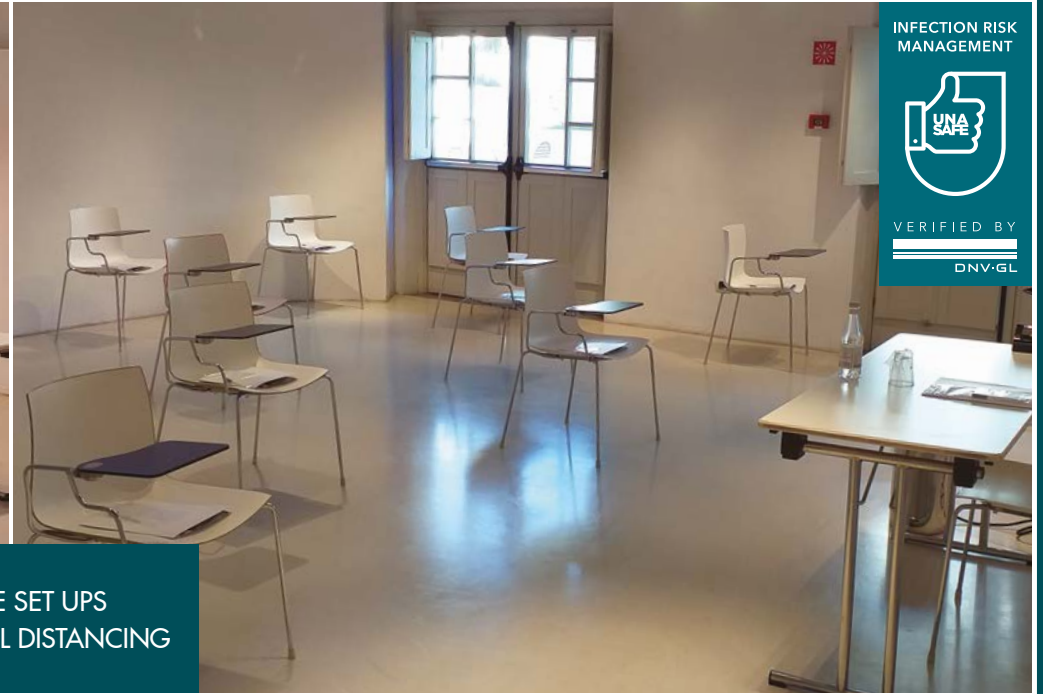
SAMPLE SET UPS WITH SOCIAL DISTANCING